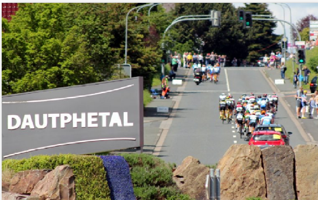
Blick vom Kreisel am Beginn der ansteigenden Zielgeraden, im weiteren Verlauf noch 100 m flach zum Ziel.

Rad Bundesliga Junioren / Masters Einschreibung am Start: 12.50 - 13.30 Uhr