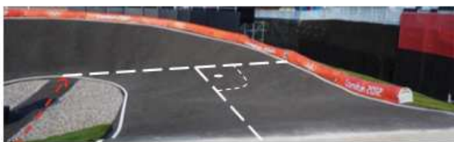
Bottom line and Inner radius